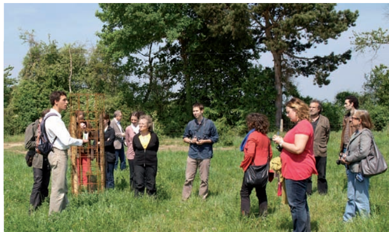
Discussion autour des jeunes arbres agroforestiers de la Bergerie de Villarceaux.

1 - Marcoussis, Saulx les Chartroux, Champlan, Nozay et Villebon-sur-Yvette.