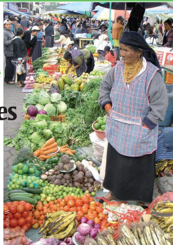
Le gouvernement équatorien soutient le développement des marchés paysans.

Dans l'Union européenne, de nombreuses actions concernant les circuits courts mobilisent le programme Leader (Liaison entre actions de développement de l'économie rurale), financé par le Fonds européen agricole pour le développement rural (issu du second pilier de la Politique agricole commune). Ce soutien financier indirect 3 aide, par exemple,