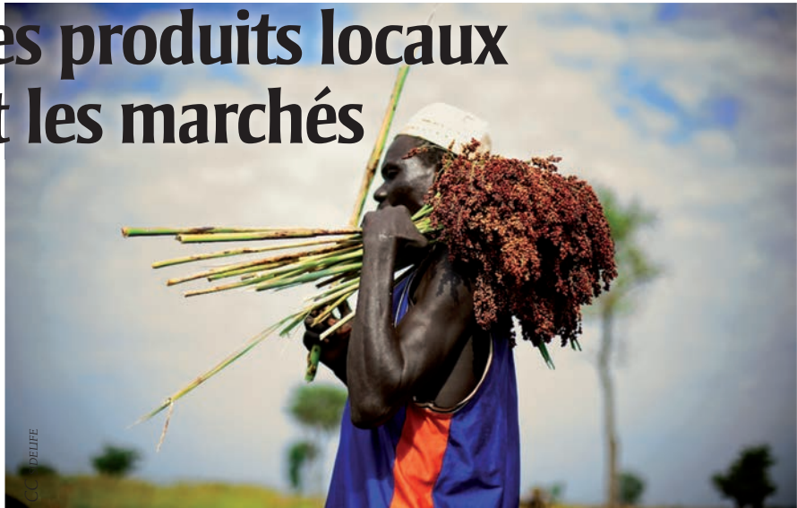
Dans nombre de pays africains, le sorgho est considéré à la fois comme un « aliment-santé » et un produit traditionnel.

Selon Nicolas Bricas, chercheur au Centre de coopération internationale en recherche agronomique pour le développement (Cirad), les comportements alimentaires urbains en Afrique ne se résument pas à une opposition entre produits importés et circuits courts locaux. L'alimentation et le choix des ali-