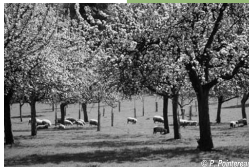
Le pré-verger, c'est beau et c'est bon

vinasses qui représentent respectivement 40% et 57% de la masse finale, se voient alloués les coûts énergétiques dans les mêmes proportions. Or, l'éthanol concentre l'énergie finale et constitue le seul produit vraiment valorisé aujourd'hui ; il aurait ainsi dû se voir attribuer l'ensemble des coûts énergétiques. D'où un coût énergétique de fabrication de l'éthanol plus faible que ce qu'il est vraiment, et donc une EE gonflée. De même, une partie du CO 2 dégagé est affectée aux vinasses, diminuant ainsi le coût en gaz à effet de serre de production de