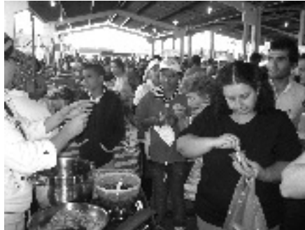
Journée « Les chefs au marché » à Piracicaba

Mais Terra Mater tente aussi de diffuser plus largement ses initiatives pour défendre l'importance de l'alimentation, de l'agriculture paysanne et agro-écologique. Ainsi, elle a organisé avec Slow Food 1 une « Semaine de l'alimentation ». Dans le cadre de l'année de la France au Brésil, celle-ci a été mise à l'honneur lors de cette manifestation par des échanges culinaires franco-brésiliens, la projection du film Le monde selon Monsanto ou un débat que j'ai eu le plaisir d'animer autour de la question