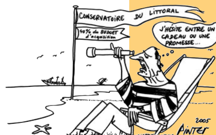
Le cadeau d'anniversaire de Chirac au littoral p. 3

En 2000, les agriculteurs du département, la Sedac en tête, font pression sur le préfet pour obtenir des contrats supplémentaires. 1800 contrats sont alors débloqués au niveau national >