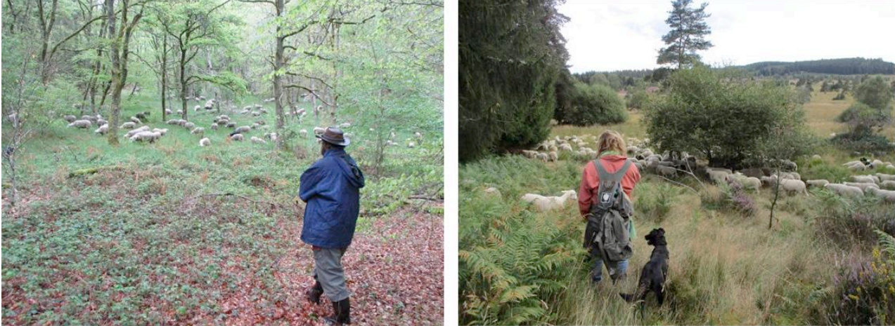
Photos 3 et 4 : Eleveur-berger et berger salarié conduisant leur troupeau à la garde, en sous-bois forestier en début de printemps (gauche) et sur tourbière dans le courant de l'été (droite)

végétations abondantes mais plus fibreuses (tourbières à molinie par exemple). L'accès quotidien à de nouveaux espaces et la diversité alimentaire sont utilisés pour stimuler l'appétit des troupeaux (Meuret, 2011). En permettant d'explorer un large périmètre, la conduite à la garde permet également d'aller chercher des ressources supplémentaires éloignées du siège de l'exploitation, élément clé en période d'étiage fourrager.