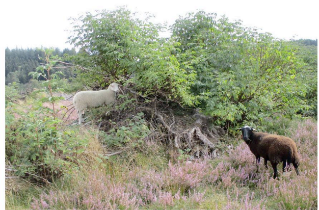
Photos 1 et 2 : Pâturage des brebis en système économe : en sous-bois de canche flexueuse en sortie d'hiver (gauche); sur friche forestière avec sureau noir bordé de callune en fleur en fin d'été (droite)