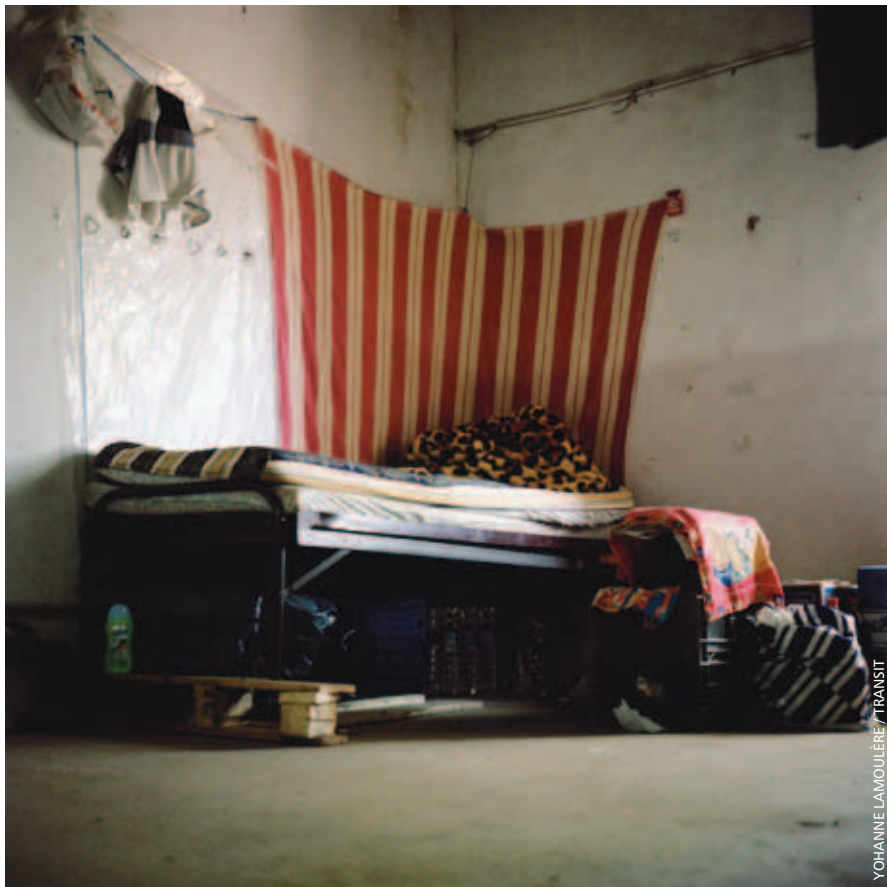
Logement de saisonniers à St Martin de Crau, en juillet 2005, dans un mas délabré au milieu des vergers ; des palettes servent de cloisons entre les lits. Dans le cadre des contrats OMI, l'employeur est tenu de proposer des logements aux saisonniers.

Les mutations post-1945 que connaît l'agriculture (remembrement, mécanisation, utilisation croissante d'intrants et recours à la sélection végétale et animale) s'accompagnent de la consécration de « l'exploitation familiale » à deux unités de travail. Cette évolution s'assortit d'une diminution de la part des salariés permanents agricoles (à noter que le poids des ouvriers étrangers parmi ces salariés permanents n'a lui pas cessé d'augmenter, passant de 8% dans les années 1930 à plus de 30% dans les années 1990). Néanmoins, de l'après-guerre au milieu des années 1970, le recours aux saisonniers étrangers a, pour sa part, été en constante augmentation (cf. graphique p.II). Le milieu des années