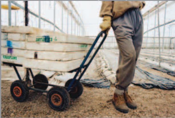
YOHANNE LAMOULÈRE / TRANSIT

Caractérisé par l'exécution de tâches normalement appelées à se répéter chaque année, à des dates à peu près fixes, en fonction des saisons, le travail agricole saisonnier a toujours existé. Mais aujourd'hui, ce salariat temporaire et précaire, souvent dénoncé pour le non respect du droit du travail, voire des droits fondamentaux des personnes, change de visage.