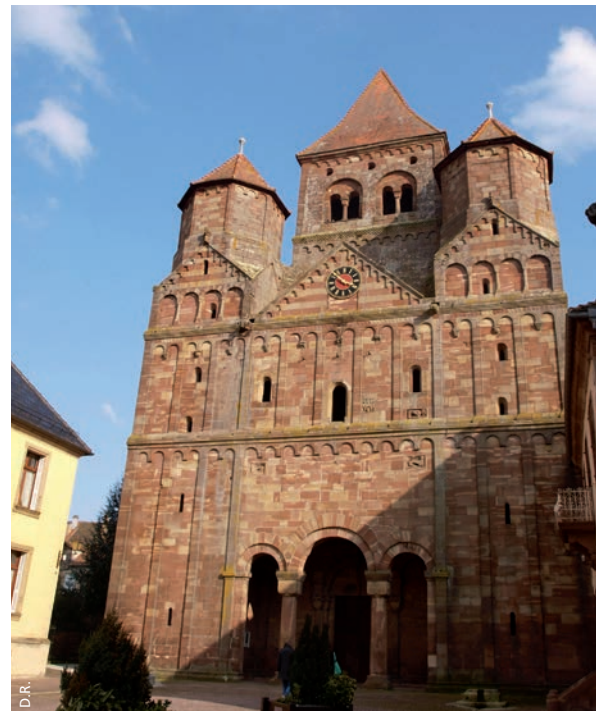
L'abbatiale de Marmoutier témoigne du rôle structurant qu'a eu l'Église sur le territoire.

les vergers rappellent ainsi une économie rurale reposant en partie sur l'exploitation familiale. Ces deux ressources sont aujourd'hui peu valorisées alors qu'elles constituaient jusqu'au siècle dernier la base d'une activité d'exploitation forestière (scieries) et de cueillette de fruits (notamment pour la distillation). Les habitants du territoire se reconnaissent également comme intégrés dans une « culture alsacienne » avec sa langue et ses multiples expressions artistiques, souvent ■■■