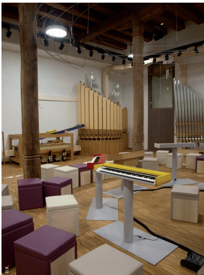
Un Centre d'interprétation du patrimoine consacré à l'orgue et aux flûtes du monde ouvrira bientôt ses portes à Marmoutier. Cet ambitieux projet de médiation culturelle pourrait devenir une locomotive pour le tourisme sur le territoire mais doit aussi être approprié au niveau local, où il est avant tout perçu comme un projet d'élus et de techniciens.

L'orgue est aujourd'hui au cœur d'un ambitieux projet de Centre d'interprétation du patrimoine (CIP) 2 qui devrait ouvrir ses portes dans les mois à venir. Cet instrument emblématique et rare associé à des outils numériques et de médiation très avancés pourrait devenir une locomotive pour le tourisme sur le territoire. C'est également une opportunité pour développer l'éducation musicale, notamment auprès des scolaires, et pour offrir la possibilité à des habitants curieux, musiciens professionnels ou amateurs, d'enregistrer, créer, se réunir et développer leurs compétences avec du matériel de qualité. Enfin, et c'est bien le sens d'un CIP, cette structure pourrait permettre aux habitants de mieux comprendre leur territoire et ses richesses. La médiation et l'appropriation au niveau local de cet espace est un enjeu important car le CIP n'a suscité qu'une faible implication de la population maurimonastérienne, restant avant tout un projet d'élus et de techniciens.