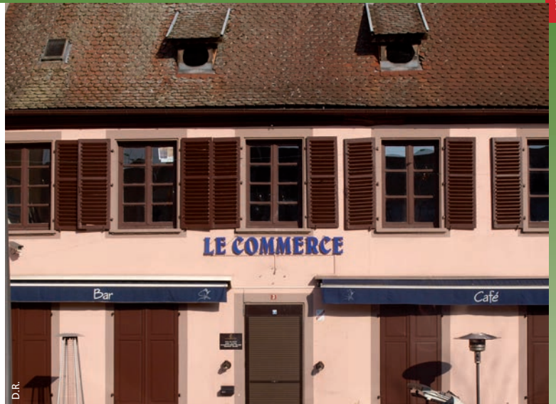
À Marmoutier et plus largement dans le Pays de Saverne, l'essentiel des établissements employeurs relève du secteur tertiaire.

La qualité du paysage rural rend le territoire attractif pour les urbains, désireux de s'installer à la campagne. L'accès est relativement simple, facilité en partie par la présence d'un des axes majeurs du territoire, la RD 1004, route reliant historiquement Strasbourg à Paris via Saverne. Le territoire de Marmoutier est donc lié à l'agglomération strasbourgeoise et des indices traduisent cette influence urbaine : l'accroissement des commerces et services de proximité (quatre restaurants, trois banques, une auto-école et une zone commerciale, aux abords de la RD 1004) qui génère de l'étalement urbain. Sur le territoire, on retrouve notamment un commerce de grande distribution