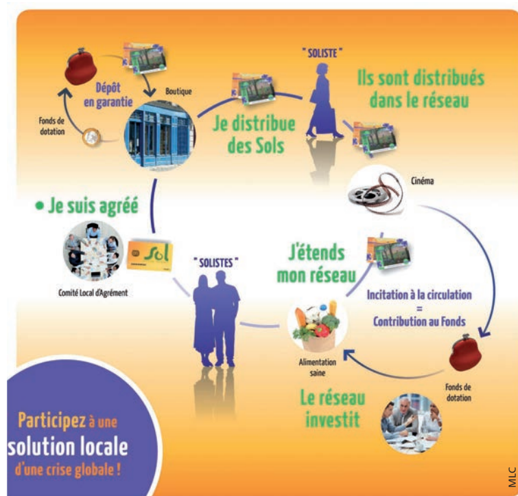
Le Sol Violette toulousain est l'une des premières monnaies locales complémentaires mises en place en France ; il en existe aujourd'hui plus d'une soixantaine (en activité et en projet).

les MLC ont pris modèle sur le Sol Violette et se sont indexées à l'euro. Cela permet de rassurer les commerçants, qui peuvent reconverter facilement la monnaie locale reçue