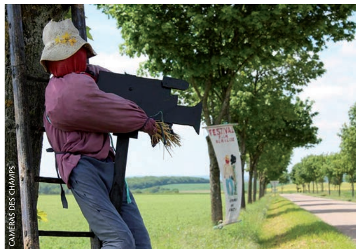
CAMÉRAS DES CHAMPS

Le réjouissant film de Johanna Turpeau, Que ta volonté soit fête qui raconte la naissance du festival