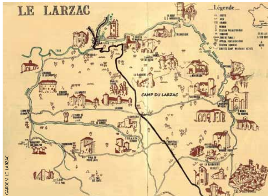
GARDEM LO LARZAC