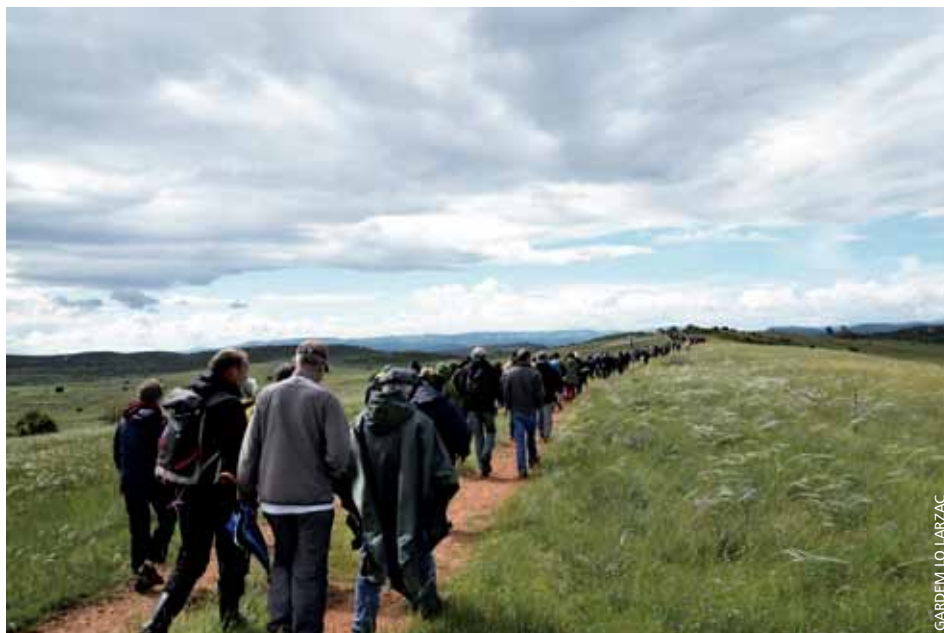
Le 18 juin dernier, une marche « pour la paix et la démilitarisation de la Terre et du Larzac » a rassemblé près de deux cents personnes sur le Plateau.