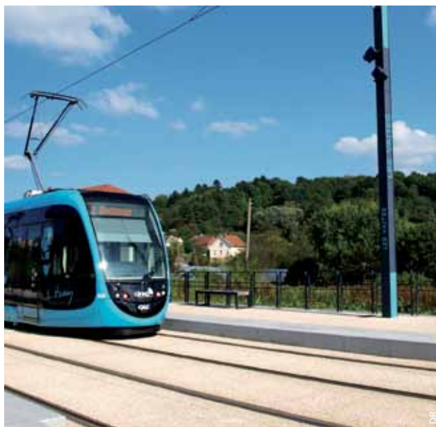
En attendant l'éco-quartier, la ligne 1 du tram, inauguré les 30 et 31 août 2014, dessert les jardins ouvriers.