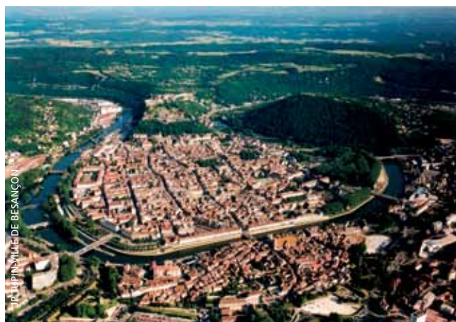
Vue aérienne du centre de Besançon, de la Boucle du Doubs et de la Citadelle.

Besançon est aussi, historiquement, une ville industrielle et militaire ; en 1883, 500 000 montres (90% de la production française) y étaient fabriquées.