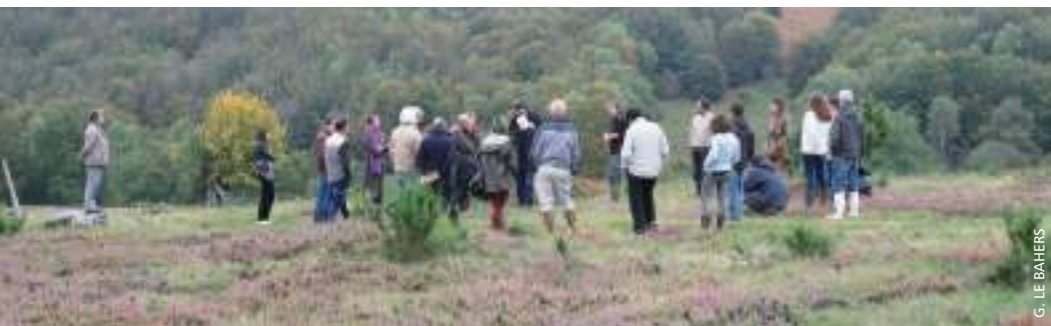
G. LE BAIERS

tion à la carotte et au bâton » apparaît peu satisfaisante face aux enjeux actuels : rétablir des équilibres écosystémiques pour la santé de tous, en préservant une activité économique sur l'ensemble des territoires.