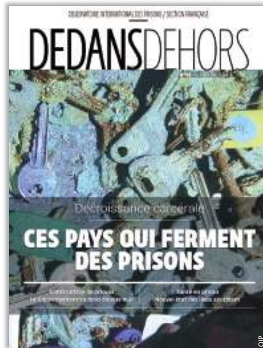
La section française de l'Observatoire international des prisons est une association loi 1901 qui agit pour le respect des droits de l'Homme en milieu carcéral et un moindre recours à l'emprisonnement. Elle édite le mensuel Dedans-Dehors .

Les réformes menées dans les années 1980 ont ouvert le marché carcéral aux entreprises françaises. Depuis, la plupart des constructions de prison se font par le biais de partenariats publics privés (PPP), lucratifs pour les entreprises bâtisseuses comme Sodexo, Engie ou Bouygues.