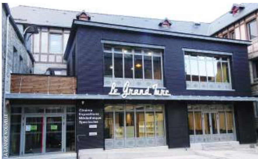
Il y a quelques années, la municipalité de La Ferté-Macé, dans l'Orne, a réalisé d'importants travaux dans sa bibliothèque pour faire tomber les barrières culturelles.

ment. Traditionnellement, les missions principales des bibliothèques sont de donner accès à la culture, aux pratiques culturelles, à l'information et à la formation 2 . Si ces ambitions ne sont absolument pas à remettre en cause, la manière de les atteindre peut être renouvelée par le modèle de la « bibliothèque troisième lieu ». Développée aux États-Unis dans les années 1980, la notion de troisième lieu décrit des espaces (d'une ville ou d'un village) qui ne sont ni familiaux, ni professionnels. Ces endroits « neutres », comme les bars ont pu l'être à une époque, sont le terreau d'une vie communautaire informelle ouverte. Appliqué à la bibliothèque, ce concept transforme les temples du livre en des lieux de rencontres, modulables selon les besoins et pratiques des usagers qui ont leur mot à dire dans l'organisation quotidienne.