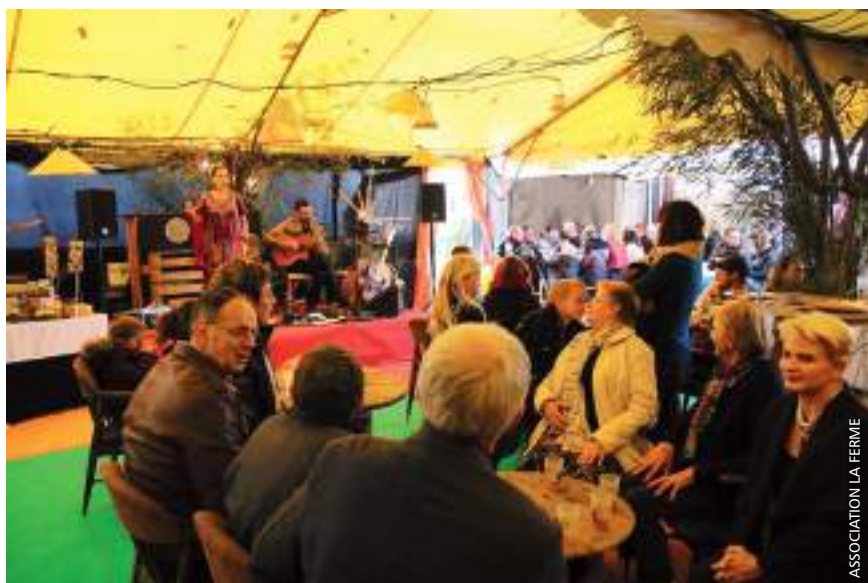
En rural, on passe vite du statut de « consommateur culturel » à celui d'acteur, comme à La Ferme K'on Écoute, à Hauterive dans l'Orne.