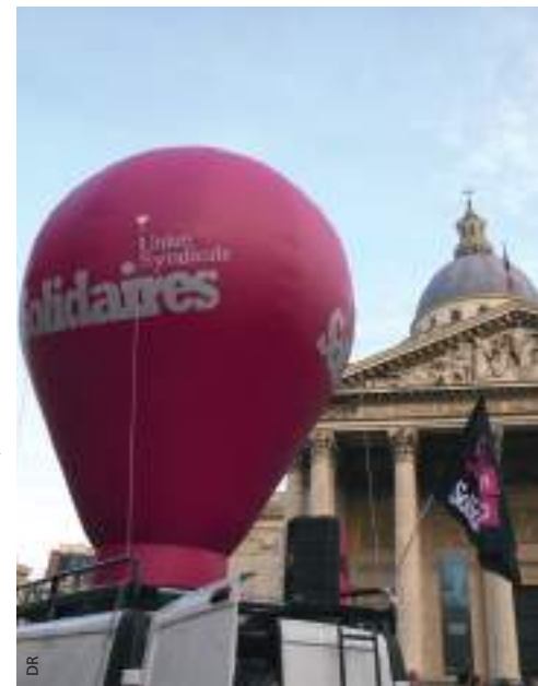
« Aux contrats-aidés, la patrie reconnaissance. »

1 - Un collectif des Coûteu.x.ses et Inefficaces s'est d'ailleurs constitué en réaction : https://couteuxsetinefficaces.wordpress.com .