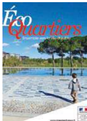
L'État communique régulièrement sur les aspects positifs

ferment et entre 4 000 et 6 000 logements seraient inoccupés 4 . « Le peu de campagne qui reste, on le bouffe, on détruit notre outil de travail et un espace naturel qu'on entretient depuis des années », déplore-t-elle.