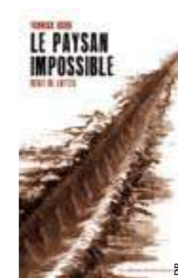
(Paru en juin 2017)