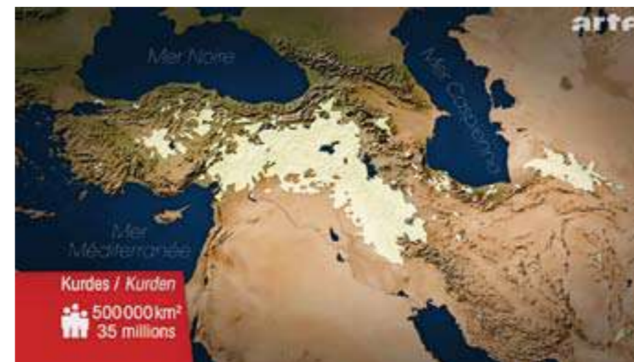
LE TERRITOIRE DU KURDISTAN EST À CHEVAL SUR LA TURQUIE, LA SYRIE, L'IRAN ET L'IRAN

Depuis 2015 et la victoire des armées volontaires kurdes contre l'État islamique en Syrie, on entend beaucoup plus parler du Kurdistan, ce territoire promis dans un traité à ses habitants par les vainqueurs de la Première Guerre mondiale lors du démantèlement de l'Empire ottoman en 1919, mais jamais octroyé dans les faits. Il devient aussi, pour certains, un exemple de ce que pourrait être un Moyen-Orient progressiste et émancipateur 1 . Le Kurdistan s'étend sur une partie de la Turquie, de la Syrie, de l'Irak et de l'Iran et compte 35 millions d'habitants mais aussi près d'1,5 million d'exilés, en France et en Allemagne notamment. Et la question kurde traverse régulièrement l'actualité (y compris depuis un mois avec le bombardement de territoires de sa partie syrienne par la Turquie) à coups de révolutions manquées, de guérillas contre l'État turc ou de revendications pour la libération du leader du PKK, le Parti des Travailleurs du Kurdistan, force motrice majeure pour la libération du pays (sauf en Irak où il est en concurrence avec le PDK, Parti Démocratique du Kurdistan). Olivier Grosjean est politiste et auteur de La révolution kurde. Le PKK et la fabrique d'une utopie , publié en septembre dernier 2 . Dans ce livre, il s'intéresse au processus historique d'autonomie qui se construit dans certaines zones de ce territoire du Moyen-Orient. « Il s'agit d'une région essentiellement montagnarde, donc là-bas le rural est souvent synonyme