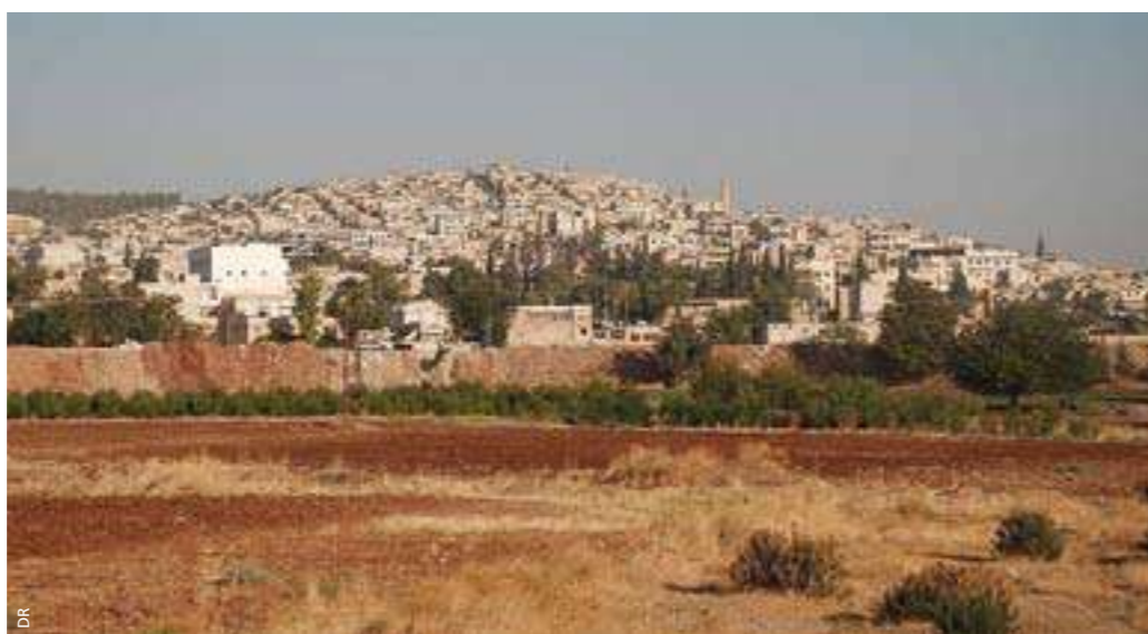
Depuis mi-janvier, le gouvernement turc mène une offensive armée dans la région kurde d'Afrin, ville de plus de 35 000 habitants située dans le Rojava, en Syrie.

Le nationalisme et l'État turc se sont construits, après l'Empire ottoman, sur le modèle de la suppression des différences ethniques, sociales, culturelles entre les individus, à l'image de la société française. Le leader turc de l'époque, Atatürk, a même importé l'idée de laïcité dans la constitution des années 1920. Depuis, ce nationalisme a été maintes fois réapproprié et est aujourd'hui utilisé par le président turc comme rempart à toute critique politique. Les Kurdes en font les frais et la guerre larvée menée contre ces « séparatistes » sert depuis quarante ans de diversion à l'État turc. Ainsi, dans les années 1990, ce dernier va mener une attaque sournoise, via la construction de barrages au Kurdistan pour soi-disant moderniser la région; mais en fait cette politique d'aménagement consiste à incendier des forêts, détruire des villages dans le but de couper les vallées, afin d'empêcher la circulation de la guérilla et le soutien apporté par les habitants des villages. « L'État va pousser les villageois à partir en ville, la ville de Diyarbakir, par exemple, va voir sa population doubler entre 1990 et 2000, détaille Olivier Grosjean. On va assister à une rurbanisation des villes, c'est-à-dire que les gens vont s'y regrouper en gros villages, où l'anonymat citadin n'existe pas vraiment. Mais, par contre, les élections de 1999 vont voir