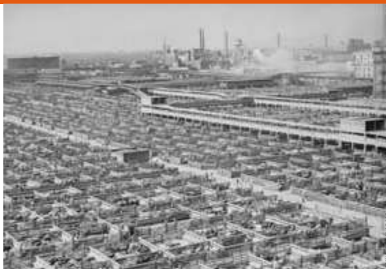
L'industrialisation de l'agriculture n'est pas un processus nouveau, comme en témoignent ces parcs à bétail, photographiés en 1947 à Chicago aux États-Unis.

Paysans et contrôleurs des administrations se côtoient souvent, se toisent voire même s'invectivent sur le terrain. Ces deux professions partagent plusieurs points communs comme une forte syndicalisation. Mais syndicats de paysans et de fonctionnaires se rencontrent peu. Début février, la CGT Agri nous a accueillis dans son local parisien pour un échange avec la Confédération paysanne centré sur les normes et les contrôles en agriculture. Sollicité pour participer à cette rencontre, le Collectif hors normes (cf. pXI) n'a pas donné suite.