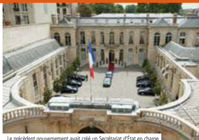
Le précédent gouvernement avait créé un Secrétariat d'État en charge de la réforme de l'État de la simplification, rattaché au Premier ministre.

Une deuxième catégorie serait constituée de normes volontaires élaborées par des acteurs privés, au sein de différents organismes comme l'Association française de nationalisation (Afnor), le Comité européen de normalisation (CEN), l'Organisation internationale pour la normalisation (Iso) ou d'organisations professionnelles. L'Afnor définit ces normes comme « des lignes directrices, des prescriptions techniques ou qualitatives pour des produits, services ou pratiques au service de l'intérêt général, élaborées collectivement, à la demande et avec le concours actif des parties intéressées ». Elles s'appliquent à la plupart des biens ou services existants aujourd'hui, du format du papier à lettre aux prises des chargeurs de téléphones portables, en passant par la taille des tomates. Elles concernent directement