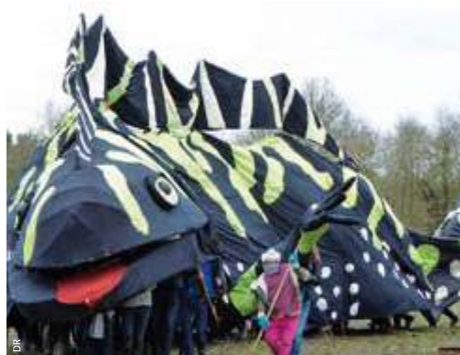
Le 10 février dernier, l'abandon du projet d'aéroport a été fêté sur la Zad dans une ambiance de carnaval par quelque 30 000 personnes.

Ce que ces mots font de bien dans une époque où tout nous porte à croire qu'il est vain de se battre, chacun peut le sentir. Leur insolence est proportionnelle à la pression constante pesant sur le bocage depuis presque une décennie, ou au sein des manifestations de rue dans les villes de France. Le 17 janvier, des messages nous sont parvenus de toute l'Europe, tant l'expérience de la Zad est emblématique, du fait de sa durée, de sa consistance, de sa capacité d'agrégation et de son audace. Mais ce qui nous toucha plus encore, ce furent les accolades que nous donnèrent les anciens sous le hangar de la Vacherit, celles et ceux qui avaient gagné au Pellerin, au Carnet, à Plogoff et qui levaient leurs verres au retour de cette saine peur des notables de ne plus pouvoir mener leurs grands projets dans ce pays. [...]