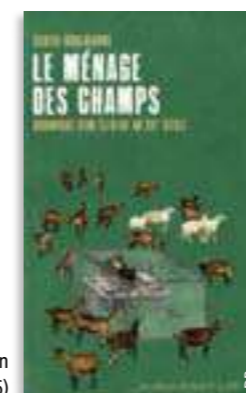
(Paru en septembre 2016)