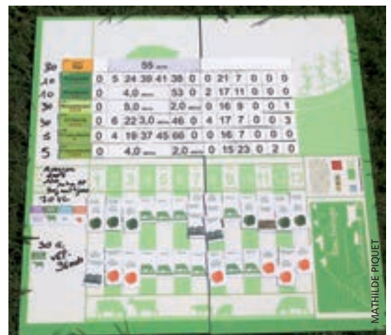
Le « rami fourrager » est un jeu participatif de conception de systèmes d'élevage, imaginé dans le cadre d'un programme PSDR.

loppé par l'Inra de Toulouse dans le cadre du projet Climfourrel, le « rami fourrager » 1 répond à ces exigences. Ce jeu illustre des scénarios élaborés par des groupes de 2 à 4 agriculteurs durant un atelier de quelques heures, avec l'aide d'un conseiller technique et d'un animateur de jeu. Le principe est de penser la gestion d'un élevage sur une année, découpée en 13 périodes de 4 semaines, en tenant