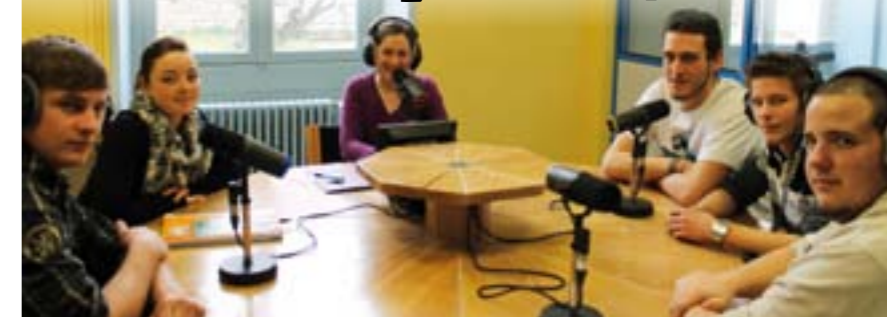
Les enquêteurs sont allés livrer leurs conclusions à la radio.

La surface agricole utile a été divisée par deux en trente ans et le nombre d'agriculteurs divisé par six dans le Loir-et-Cher. Ce constat alarmant nous a poussé, en relation avec le MRJC de Blois, à nous pencher sur la gestion du territoire aux alentours de Vendôme. Nous avons donc mené l'enquête, en équipe, auprès de nombreux acteurs du territoire. La rencontre avec des élus, des agriculteurs et des associations de protection de la nature ou de chasse, nous a permis de connaître leur point de vue et de mieux comprendre l'impact de ces acteurs sur la gestion des terres. Par nos différentes origines (Champagne-Ardenne, Île-de-France ou encore Normandie), nous avons eu un regard extérieur sur le Vendômois et avons choisi d'informer et de sensibiliser les citoyens, généralement trop peu impliqués dans la gestion du foncier.