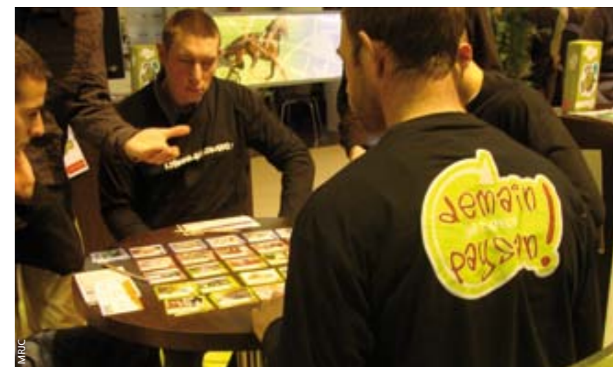
Des adhérents du syndicat Jeunes agriculteurs s'essayant aux Agronautes pendant le Salon de l'agriculture.