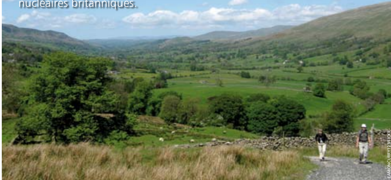
Le comté de Cumbrie, haut-lieu du tourisme vert en Angleterre, n'a pas voulu accueillir sur son territoire un centre d'enfouissement de déchets nucléaires.

Une décision des autorités de Cumbrie, comté rural du Nord-Ouest de l'Angleterre, semble enterrer un projet d'enfouissement de déchets nucléaires britanniques.