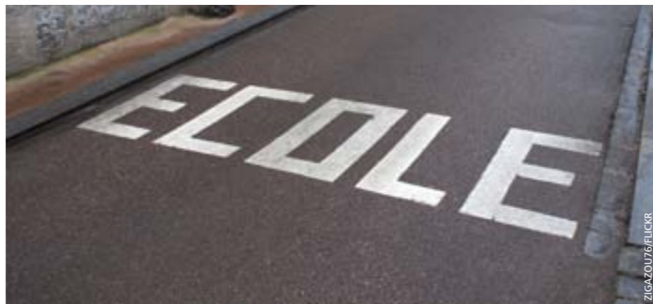
À l'heure actuelle, seul un décret, publié en janvier dernier, précise le cadre réglementaire de la nouvelle organisation du temps scolaire dans les écoles maternelles et élémentaires.

Un décret publié en janvier dernier, applicable dès la rentrée 2013, précise le cadre réglementaire de la nouvelle organisation du temps scolaire dans les écoles maternelles et élémentaires : les 24 heures d'enseignements hebdomadaires seront étalées sur quatre jours et demi et les collectivités devront assurer la prise en charge des élèves jusqu'à 16h30. Pendant le temps ainsi libéré les enfants sont censés accéder à des activités sportives, culturelles ou artistiques. Les mairies et les intercommunalités avaient jusqu'au 31 mars pour justifier d'une demande de dérogation auprès du directeur académique et ainsi repousser la mise en application de la réforme à la rentrée 2014. Mais, l'aide de l'État au financement des activités périscolaires (allant de 50 à 90€uros par élève) ne sera attribuée qu'aux