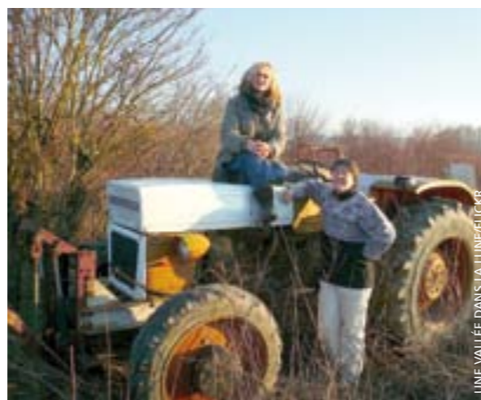
De plus en plus de femmes s'installent en agriculture, mettant fin au modèle masculin d'installation.

Les jeunes qui s'installent ont désormais les mêmes aspirations que tous et ont