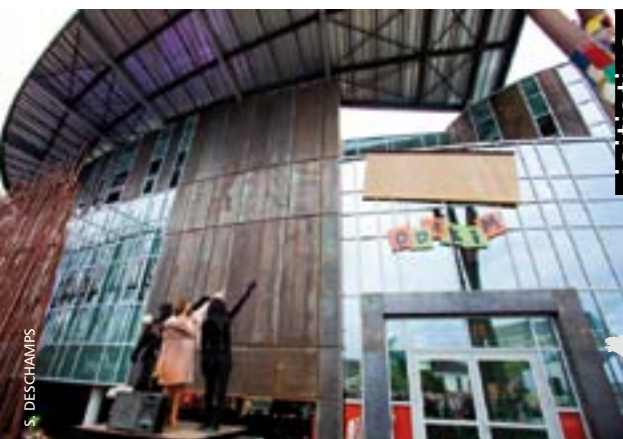
Le centre multiactivités intergénérationnel a été baptisé Okadim par la municipalité.