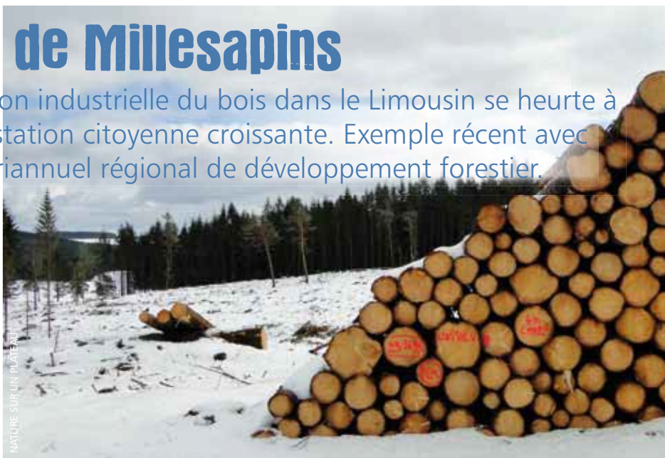
Sur le Plateau de Millevaches, les résineux, à croissance rapide et plus rentables, représentent deux tiers de la ressource forestière.

Dans le PPRDF la répartition des récoltes entre feuillus et résineux sur chacun des quinze territoires régionaux n'est pas précisée. Néanmoins, plantons le décor : le Plateau de Millesapins, pardon, de Millevaches, est un territoire forestier. Alors qu'au niveau régional la forêt est composée de deux tiers de feuillus et d'un tiers de résineux, sur le Plateau, les résineux, à croissance rapide et plus rentables, représentent deux tiers de la ressource forestière. Le Plan d'approvisionnement territorial, réalisé sur le territoire du Parc naturel régional (PNR) de Millevaches et publié en décembre 2012 2 , fournit deux conclusions claires : d'une part les résineux y sont déjà très fortement exploités et, d'autre part, la consommation actuelle de feuillus, pour moitié par les habitants pour se chauffer, correspond à la ressource disponible. D'où la question : comment couper plus de bois sur le Plateau, sans dé-