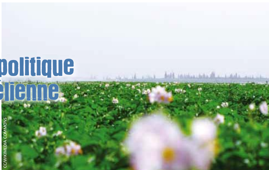
Israël exporte du coton dont la culture intensive est très gourmande en eau et en intrants

tion en eau est supérieure aux ressources renouvelables disponibles et la surexploitation des nappes souterraines entraîne leur salinisation, par intrusion d'eau de mer notamment. C'est le cas à Gaza où l'eau de la nappe devient peu à peu impropre à la consommation humaine. À cela s'ajoute un contexte géopolitique difficile, puisque, jusqu'en 2000, les deux tiers de l'eau utilisée en Israël proviennent d'hors des frontières de 1949 2 . À sa création, l'État d'Israël était largement dépendant des importations d'eau voisine et a rapidement cherché à sécuriser son approvisionnement. La stratégie d'expansion de l'État, notamment la Guerre des Six jours en 1967 et l'implantation de colonies dans des zones hydrologiques stratégiques, lui permet de contrôler la quasi-totalité des ressources en eau de la région. À l'heure où la consommation moyenne d'un Palestinien est de 70 litres d'eau par jour contre 260 litres pour un Israélien 3 , la répartition de l'eau reste largement inégalitaire dans la région.