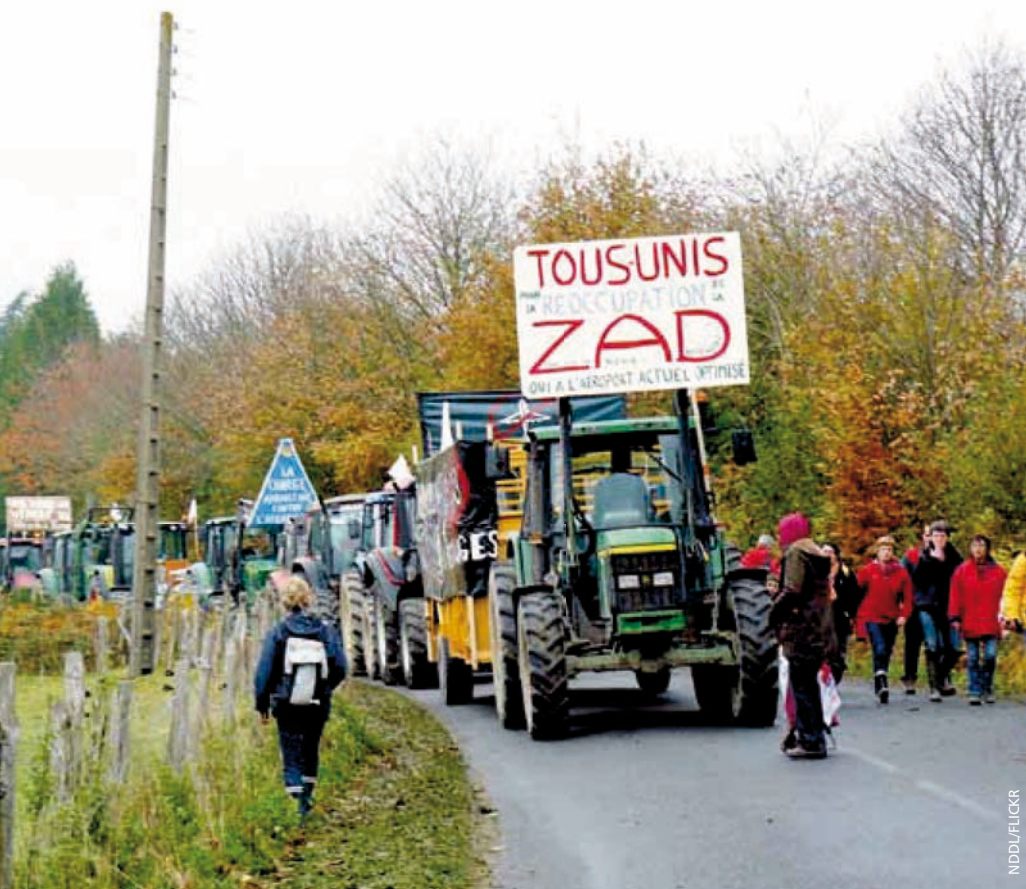
Pour Europe Écologie-Les Verts qui s'exprimait début avril suite à la remise de trois rapports sur le projet d'aéroport : « La mise en œuvre de toutes les recommandations formulées relève de la mission impossible et reporte sine die le projet ».

la ferme de Bellevue, c'est aussi en faire un pôle de compétences pour accompagner au mieux les projets agricoles ou vivriers qui sont initiés par des habitants de la Zad. [...] Aménager la ferme de Bellevue, c'est encore ouvrir un lieu phare et symbolique de la mobilisation de paysans indignés du Grand-Ouest et de toute la France, défendant une autre logique de développement, particulièrement agricole. » 3