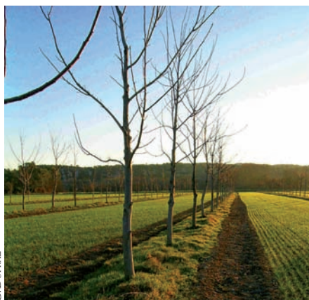
Système de culture associant des noyers et du blé dur dans le Sud de la France.

2 - Dans une étude commanditée par l'Ademe et réalisée avec Forêt cellulose bois construction ameublement (FCBA) et l'association Solagro. ( www.ifn.fr/spip/spip.php?article685 ).