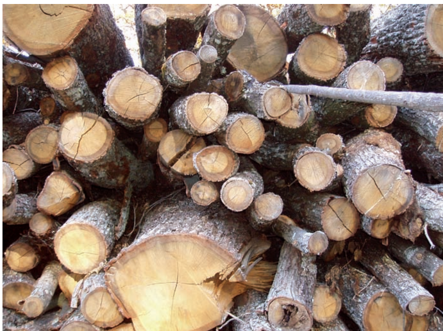
Près de 30 % du bois commercialisé part à la trituration

Il y a peu, cet article aurait commencé en rappelant que, contrairement à une crainte alimentée par les images de déforestation, la France voit, elle, s'étendre bois et forêts. Or, ce n'est plus le cas ; depuis quelques années, la surface boisée 1 nationale a en effet tendance à se stabiliser. En France métropolitaine, les forêts occupaient 9 millions d'hectares (ha) au milieu du XIX e siècle, elles recouvrent aujourd'hui 15,71 millions ha, soit 28,6% du territoire. Ce virage marque la fin d'un processus d'expansion des surfaces boisées, continu depuis Napoléon III. Cette évolution s'explique, dans un premier temps, par le remplacement du bois utilisé comme ressource énergétique. Par la suite, après-guerre, c'est principalement l'amélioration des rendements agricoles et la diminution du nombre d'exploitations et l'abandon des terres moins productives qui allaient fournir des surfaces pour le boisement. Des plantations forestières d'envergure ont également été réalisées afin d'« assainir » des terrains, protéger les sols contre l'érosion et empêcher les crues et avalanches. C'est ainsi que le massif landais, l'un des plus grands de France, a été créé à la fin du XIX e siècle.