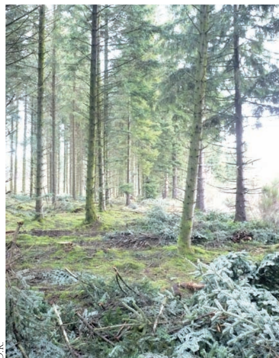
Chantier de coupe d'une monoculture de résineux dans le Morvan.

G. B. W. : Les conditions lumineuses, les strates végétales, les types d'écorces définissent des micro-habitats abritant des espèces animales et végétales propres au milieu forestier. La monoculture se caractérisant par une très faible diversité de combinaisons de ces facteurs, la biodiversité dans les peuplements homogènes est donc bien plus limitée que dans des forêts aux essences et âges diversifiés. Au bout de 40 ans de croissance, la coupe rase entraîne, au-delà de l'impact paysager évident, une perturbation écologique radicale : les rares espèces sauvages forestières qui ont pu s'installer meurent ou sont obligées de migrer, si elles en sont capables. Les espèces des milieux voisins vont venir coloniser les parcelles mises à jour, mais la majorité de ces espèces sont des généralistes de milieux ouverts et ne peuvent donc être considérées comme spécifiquement forestières. Une autre conséquence écologique a trait à la qualité des sols. Plus un arbre vieillit, moins il a besoin d'éléments minéraux pour croître. Donc ne cultiver que des arbres jeunes génère un appauvrissement des sols 3 .