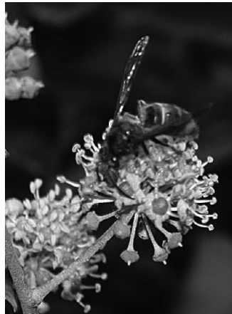
Vespa velutina dit frelon asiatique

Oui, mais... pas la seule. Depuis quelques années déjà, les apicul-