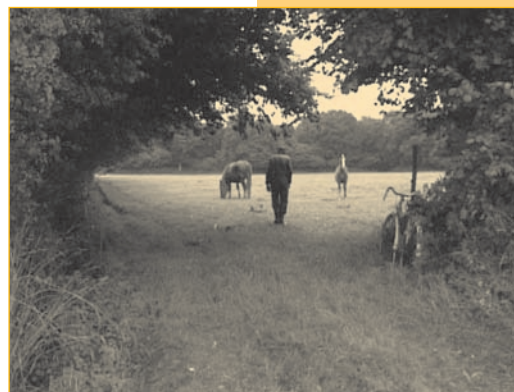
Caméras plein champs p.1-2

«Le festival me permet de mieux sentir comment l'agriculture est perçue de l'extérieur», confie un agriculteur membre du comité de pilotage. Ce >