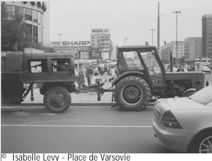
Place de Varsovie

Le paysan polonais continue d'incarner un «archaïsme» dont la société se passerait s'il n'était pas un élément central de la vie sociale du pays.