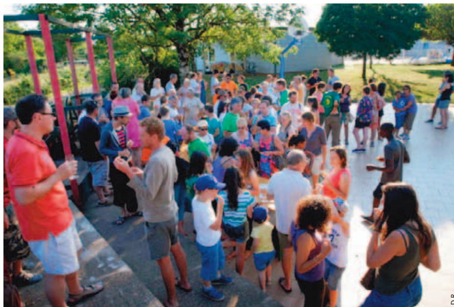
Les participants de l'AlterTour 2014 ont été reçus à Ayen le 28 juillet au village vacances.

Cet été, l'AlterTour a fait étape à Ayen en Corrèze, commune de moins de 3 500 habitants engagée dans une démarche d'Agenda 21.