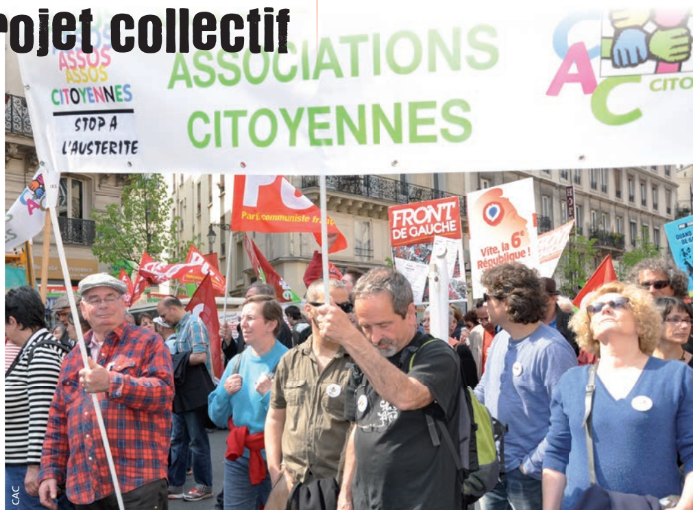
Le Collectif des associations citoyennes se mobilise depuis 2010 contre la réduction des associations à leur seule dimension économique et défend leur contribution à l'intérêt général et à la construction d'une société solidaire.

Depuis plus d'un siècle, les associations militent pour la diffusion des savoirs, le développement d'un esprit critique et l'ouverture sur les autres. Aussi, quand les militants associatifs abandonnent l'engagement sacrificiel à une unique organisation et s'engagent pour des causes variées, plus temporaires, plus circonscrites et au sein de multiples associations, il faut d'abord s'en féliciter ! L'autonomie des individus, leur capacité à construire leur propre parcours d'éducation politique – quitte à s'affranchir des formes traditionnelles de l'engagement – voilà la rançon du succès de plusieurs dizaines d'années de travail d'éducation populaire menée, entre autres, par les associations. De même, l'évolution des modèles d'organisation par « réseau » et le délaissement des structures pyramidales au profit de structures plus horizontales illustre la reconnaissance d'une nouvelle conception de la citoyenneté que nous avons longtemps appelée de nos vœux.