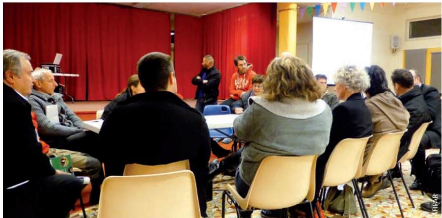
La méthode Step consiste à rassembler des acteurs de l'accompagnement pour les (faire s') interroger sur leurs visions du territoire et de ses activités, afin de s'accorder sur une organisation commune dans l'intérêt de celui-ci.