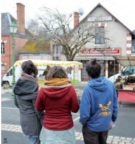
Sur la communauté de communes, on dénombre 12,5% de 15-29 ans, contre 17,5% au niveau national.

On peut également observer un manque d'établissements culturels : pas de cinéma fixe, de salles ou de bars qui proposent des concerts et peu d'ateliers culturels (arts plastiques, musique...) dédiés aux jeunes. Il faut faire plus de trente kilomètres pour avoir accès à ces propositions et l'absence de transports en commun isole les personnes sans permis. De plus, il y a peu de professionnels proposant des activités et animations pour les adolescents, à part