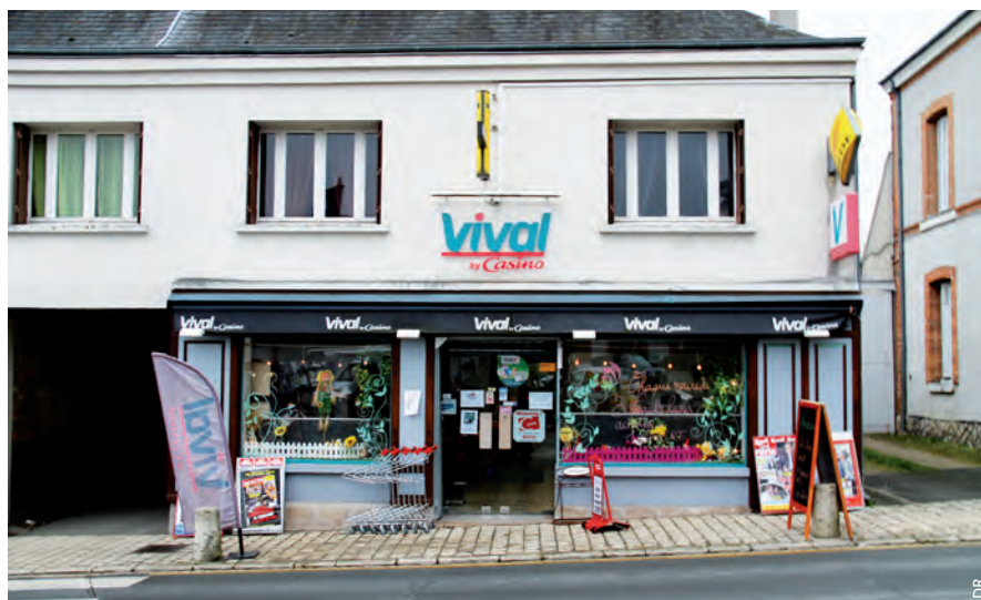
Dans le cadre de la reprise en octobre 2016 de la superette Vival à Neung-sur-Beuvron, Initiative Loir-et-Cher, association d'accompagnement à la création d'entreprise, a prêté de l'argent aux futurs commerçants.

Des entreprises, comme celles liées au numérique ou à des techniques de pointe, connaissent une véritable croissance, notamment grâce à l'Écoparc, projet phare de la communauté de communes qui y a investi 1,8 million d'euros en 2016. Cette zone d'activités intercommunale créée en 1995 regroupe aujourd'hui plus de 230 salariés dans 34 entreprises, dont 22 se sont installées après 2014 : bureau d'étude sur la construction et la rénovation écologique, fabriquant de protections balistiques, sociétés de sécurité informatique et électrique, de conception de béton de chanvre, d'interfaces informatiques pour médecins... Elles se sont implantées en raison des services proposés comme l'accès à internet, des loyers réduits, des avantages fiscaux liés au classement en Zone de revitalisation rurale, du cadre et de la communication sur le lieu.