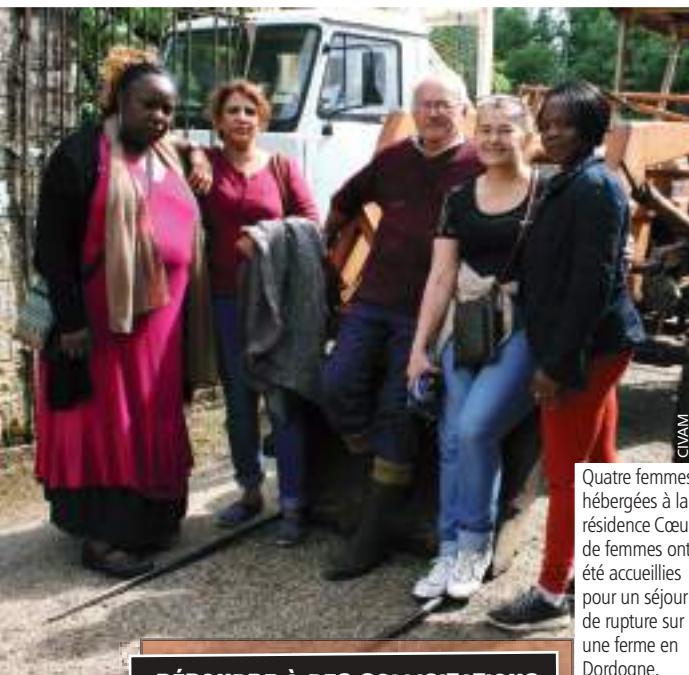
Quatre femmes hébergées à la résidence Cœur de femmes ont été accueillies pour un séjour de rupture sur une ferme en Dordogne.