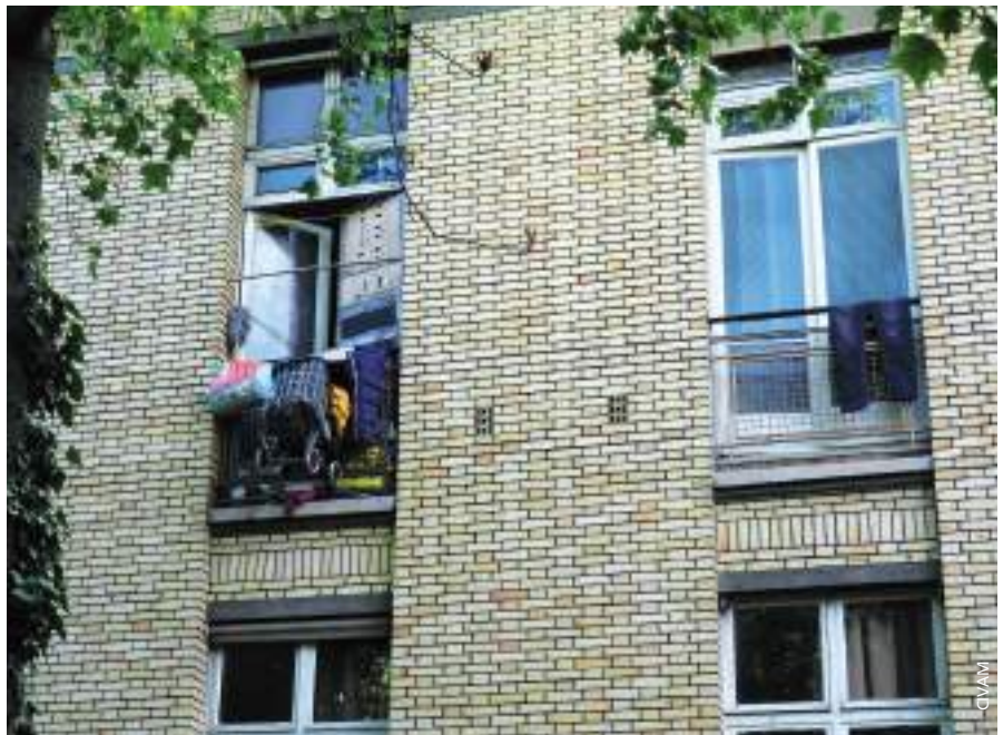
Il n'y a pas assez de places d'hébergement pour accueillir les demandeurs d'asile, notamment à Paris.

Le travail est un autre facteur déterminant. Depuis 1991, les demandeurs d'asile - au moins pendant les neuf premiers mois suivant leur demande - n'ont pas le droit de travailler, mais peuvent se