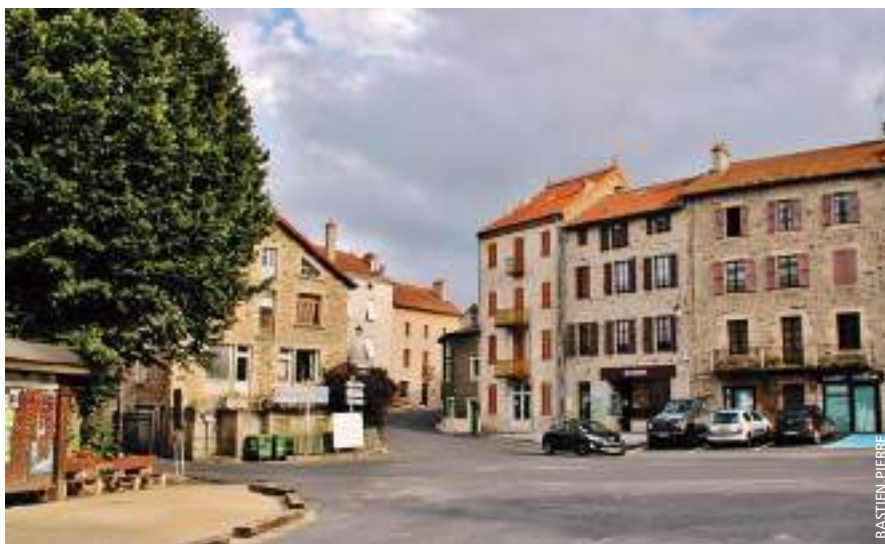
À Chambron-le-Château, village de Lozère d'environ 300 habitants, un Centre d'accueil pour demandeurs d'asile avec une capacité d'hébergement d'une cinquantaine de personnes a ouvert en 2003. Depuis, un programme de rénovation d'hébergements dédiés aux réfugiés a été lancé sur la commune.

« Le Cada [Centre d'accueil pour demandeurs d'asile] est aussi un enjeu financier pour les structures et les territoires : des nouvelles populations avec des enfants qui remplissent les écoles, qui boostent la