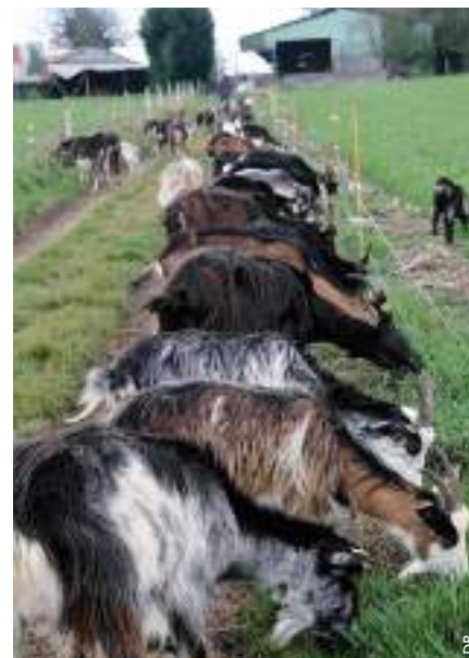
Les Chèvres des Fossés présentes sur l'exploitation d'Antoine et d'Aurore sont des animaux rustiques qui produisent peu en volume en système tout herbe sans concentrés.

Pour la salle de traite, auto-construire permettait, comme pour la stabulation,