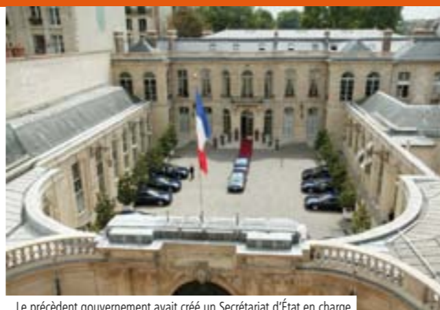
Le précédent gouvernement avait créé un Secrétariat d'État en charge de la réforme de l'État de la simplification, rattaché au Premier ministre.

Une deuxième catégorie serait constituée de normes volontaires élaborées par des acteurs privés, au sein de différents organismes comme l'Association française de nationalisation (Afnor), le Comité européen de normalisation (CEN), l'Organisation internationale pour la normalisation (Iso) ou d'organisations professionnelles. L'Afnor définit ces normes comme « des lignes directrices, des prescriptions techniques ou qualitatives pour des produits, services ou pratiques au service de l'intérêt général, élaborées collectivement, à la demande et avec le concours actif des parties intéressées ». Elles s'appliquent à la plupart des biens ou services existants aujourd'hui, du format du papier à lettre aux prises des chargeurs de téléphones portables, en passant par la taille des tomates. Elles concernent directement