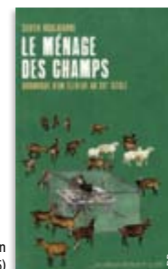
(Paru en septembre 2016)