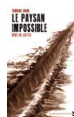
(Paru en juin 2017)