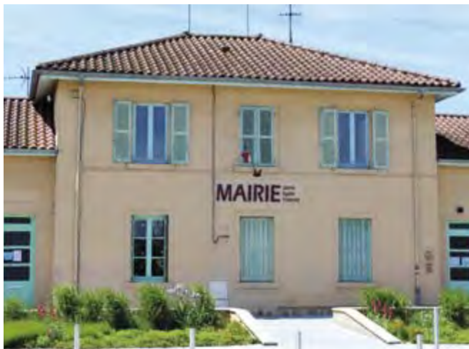
Au 1 er janvier 2017, on comptait 1 266 EPCI à fiscalité propre contre 2 062 au 1 er janvier 2016, la majorité de ces réorganisations résultant de fusions (source : www.vie-publique.fr ).