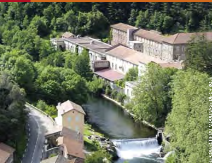
LE COLLECTIF DU MOULINAGE DE CHIROLS

Le moulinage est une des étapes du travail de la soie intervenant entre la filature et le tissage. L'opération était effectuée dans de longs bâtiments souvent installés près des cours d'eau, comme à Chirols.