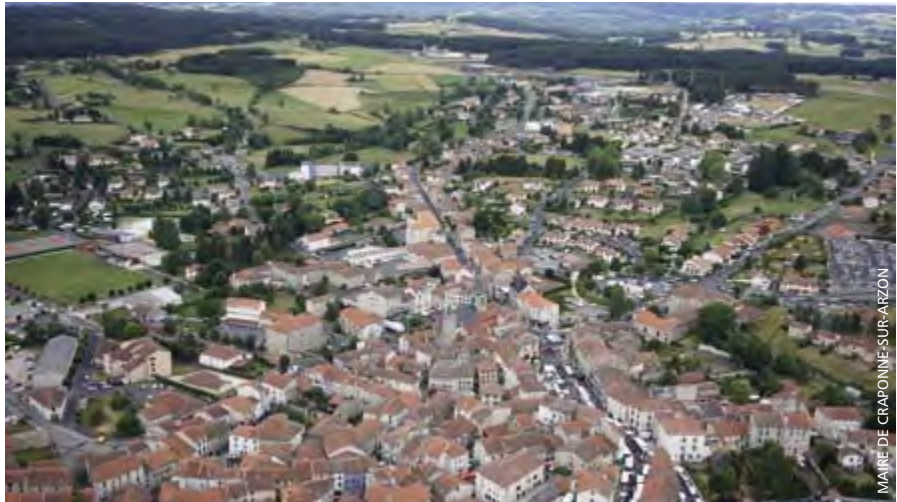
Maire de CRAPONNE SUR ARZON

munes et des intercommunalités à l'ingénierie limitée... », observe Brigitte Bienassis pour qui le repérage des initiatives, l'animation et l'ingénierie sont indispensables à une bonne utilisation des deniers publics et à la cohérence des projets d'aménagement. Modification des rôles et des relations entre l'État et les collectivités, montée en puissance de l'intercommunalité, primeur à l'investissement... les évolutions décrites par cette élue d'une commune rurale de montagne nous parlent, plus généralement, des transformations de l'aménagement du territoire en France.