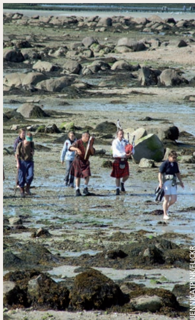
Les spectateurs rejoignent l'île de Tatihou à pied, pour écouter les concerts et bals au rythme des marées.

Tatihou n'est pas le nom exotique d'une île tahitienne... mais bien celui d'un minuscule îlot côtier situé dans la rade de Saint-Vaast-la-Hougue, au nord du Cotentin. Venant du terme viking signifiant « terre entourée d'eau », l'île est un site naturel protégé de 28 hectares qui devient une presqu'île à marée basse. Les Traversées Tatihou, qui fêtent cette année leur 20 e édition, proposent chaque année aux festivaliers de rejoindre l'île à pied, à travers les parcs à huîtres, pour dix jours de concerts qui mettent à l'honneur les traditions musicales de différents territoires maritimes du globe, l'événement ayant déjà accueilli des groupes venus d'une trentaine de pays.